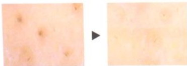
毛穴の黒ずみ汚れもすっきり

肌への負担の原因となる摩擦、吸引圧、界面活性剤を使わずケアするため、さまざまな肌質の方に対応します。ヘラには肌あたりが優しく金属アレルギーを起こしにくいチタンを採用。