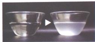
未使用の水 5分間施術使用後